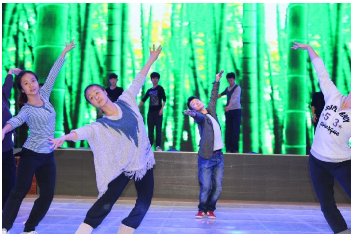
杨涛老师在指导学生排练